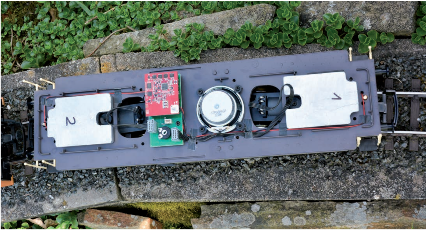
So sieht das Innenleben der BR212 mit dem mfx/DCC-Großbahndecoder aus. Auf der Grundplatte kann man das Potentiometer für die Lautstärke gut erkennen.

zurück an die Zentrale zu schicken (ähnlich wie RailCom). Auf der Schiene ist im Digital-Betrieb immer ein hochfrequentes Rechtecksignal vorhanden. Sonst unterscheiden sich die mfx-Signale von ihren DCC-Kollegen durch eine andere Kombination von kurzen und langen Impulsen. So können verschiedene Datensignale auf der Schiene nacheinander übertragen werden und nur der entsprechend eingestellte Decoder versteht seine Adresse und seine Digital-Sprache und führt die entsprechenden Befehle aus. Die Befehle von einer Zentrale zu den Fahrzeugen werden immer hintereinander gesendet. Da spielt es allerdings keine Rolle, in welchem Datenformat (Digital-Sprache) das geschieht.