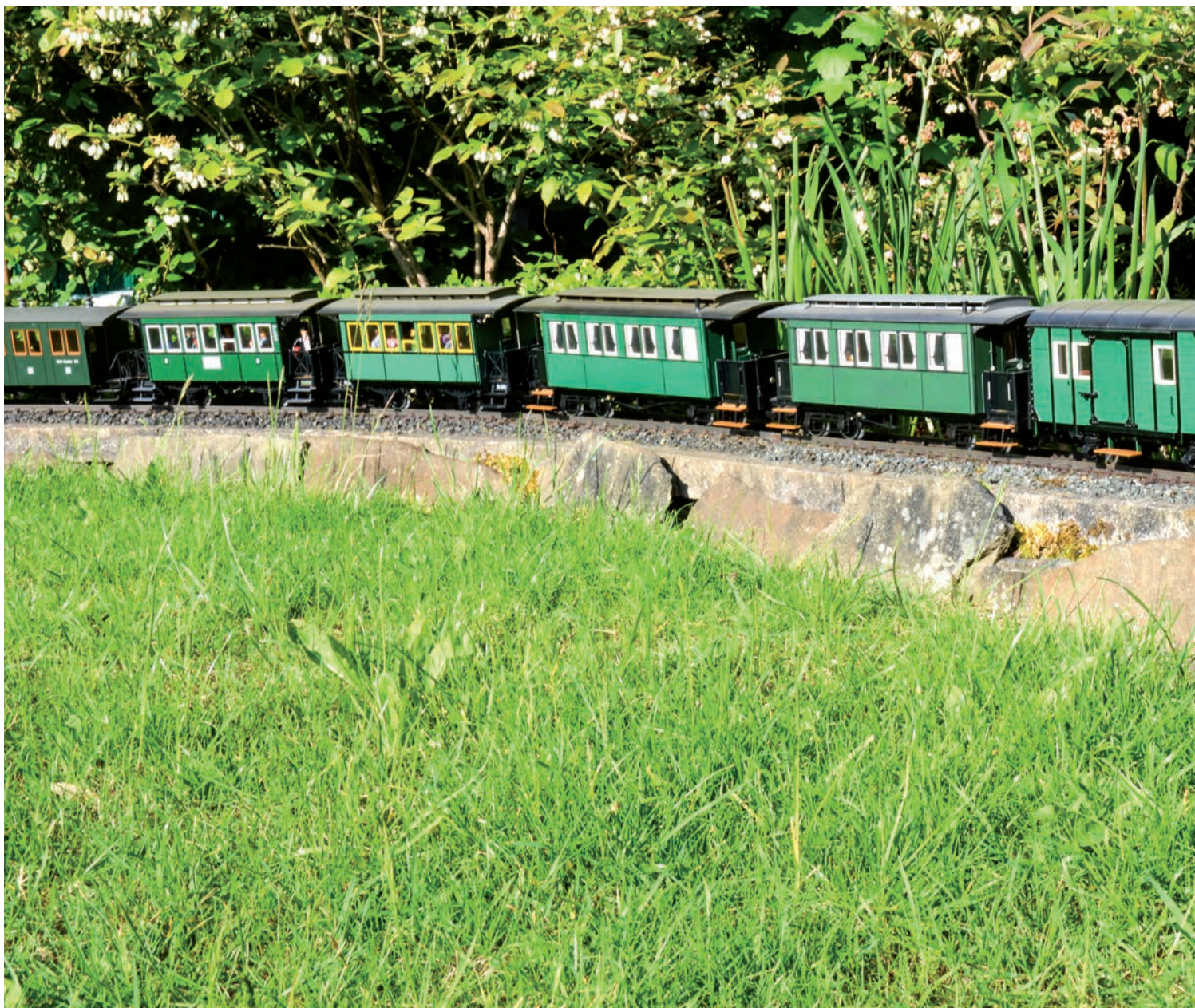
Auf der Strecke mit drei Prozent Steigung und einer Last mit 24 Achsen sorgte die Lastregelung in beiden Richtungen für ein gutes und ausgeglichenes Fahrverhalten.

durchführen. Die Decoder haben sich beim Service wie alle anderen bekannten DCC-Decoder verhalten. Die Einstellungen konnten auf dem Programmiergleis vorgenommen werden (CV schreiben und lesen), aber auch die CV-Programmierung auf dem Hauptgleis (POM), um z. B. die Lautstärke zu verstellen, funktionierte einwandfrei. Im CV29 wird neben der Fahrtrichtung die Anzahl der Fahrstufen 14/28/128, der Analogbetrieb an/aus und die lange Adresse aktiv geschaltet. Die alten MZS-Zentralen beherrschen leider nur den 14-Fahrstufen-Modus, sonst sollte der Fahrstufen-Modus auf 28/128 im Bit 1 verwendet werden. Im CV50 kann ausgewählt werden, ob der Analogbetrieb und/oder der mfx-Betrieb aktiviert sein soll. Da der Multiprotokoll-Decoder stets auf der Suche nach dem richtigen